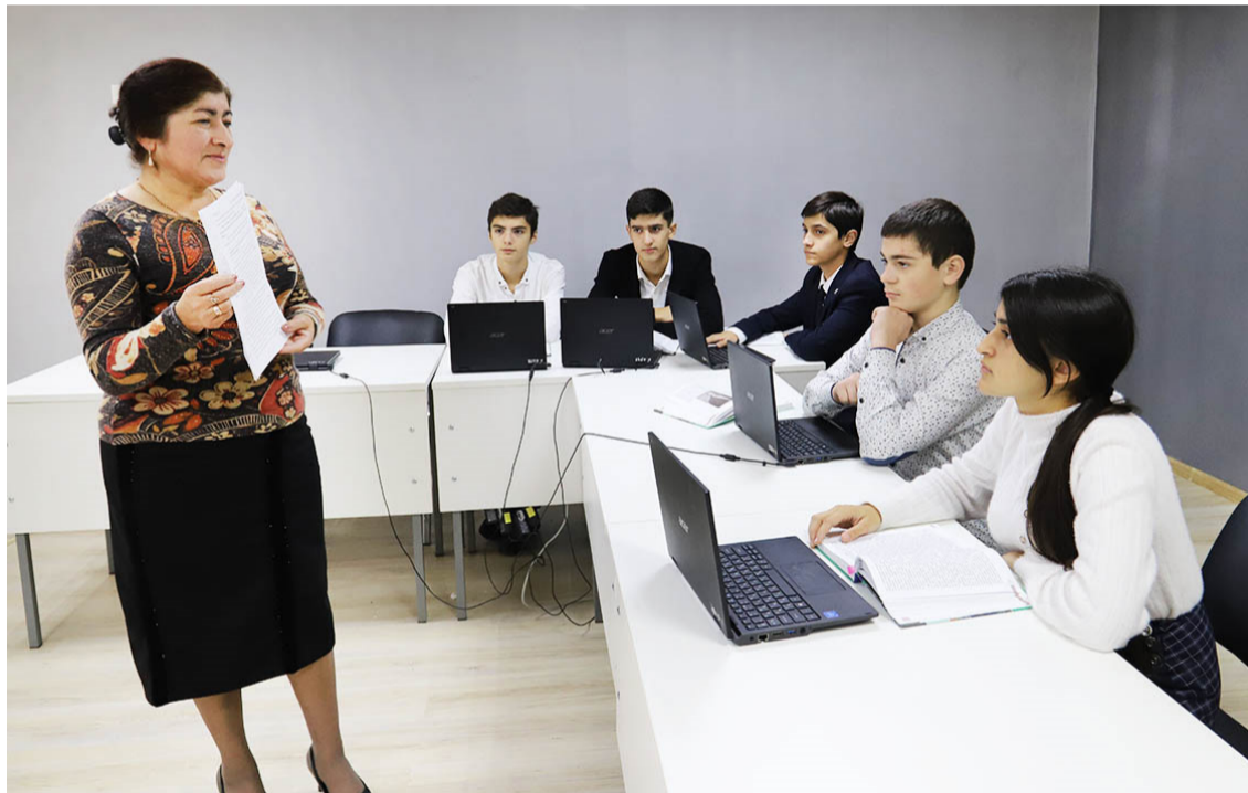
(Эвел 3-пи машнаъ.)