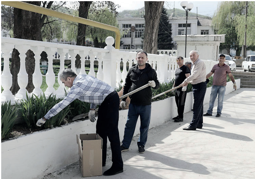
ин пишеклар кюкйир кивну, СВО-йиъ гъаклидариз бахш

Апрелин 20-диъ вари ре-спубликайиъ Сергей Ме-ликовдин жягътлувалиинди субботник кљули гъубшну. Субботникдиъ райондин вари идарийриъ лихурайи пишеклар иштирак гъахъну. Дурари райцентрин гъирагъ – бужагъ, рибчрайиъ, Ургур чвуччвун ва сар чуччун гъалайин йишв ва дидин гъирагъ- бужагъ, бицлида-рин багъарин, мектебарин гъирагъ-бужагъар ва жара йишвар марцц гъаплну. Ургур чвуччвун гъалайикан улхуруш, аьхиримжи вахтари душ'ина гъюру туристарин, агъалйирин къадар аьхюб ву, гъаддиз члуруб-члюрхюбра цлиб уч шулдар. Гъалайин лихурайи пишеклар, музей-