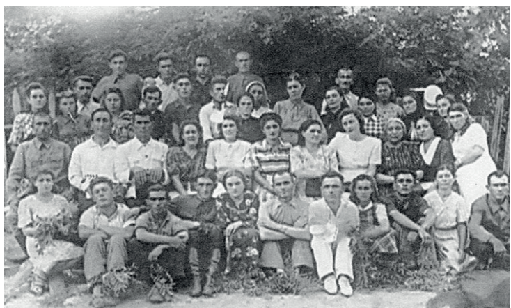
Основной состав сотрудников марагинского детского дома - 1955 год.

спечивали всем необходимым: кормили, одевали и обували. Их воспитанием занимались семь человек, приехавшие из России. В те годы после окончания педагогических училищ и институтов молодых выпуск-