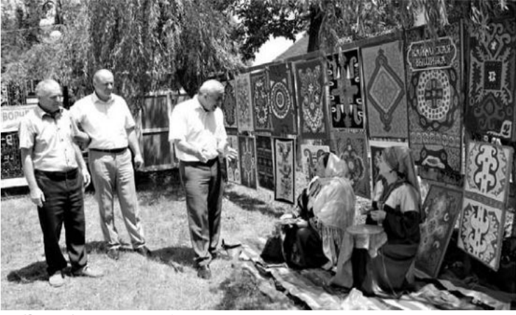
(Эвел 1-пи машнаъ).

ин» шикил айи халачайи жалб аплуи. Думу халача Дагъустандин Огни шагъриъ яшамаш шулайи табасаран дишагълийири гъубхуб вуйи.