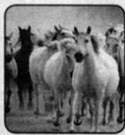
14. Стая лошадей.