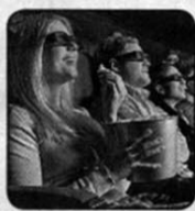
5. Демонстрация фильма.