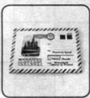
12. Координаты на конверте.