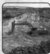
11. Место, где добывают песок.