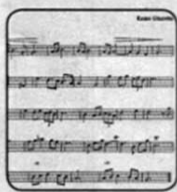
10. Медленный музыкальный темп.