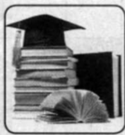
15. Результат обучения.