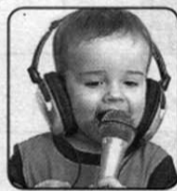
17. Мотивчик себе под нос.