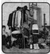
1. Баракхо, пожитки.