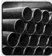
13. Материал для труб.