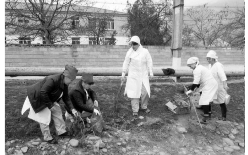
Мартдин 28-ди «Республикаин субботник» серенжемдин рамкаийди Табасаран райондизра суббот-