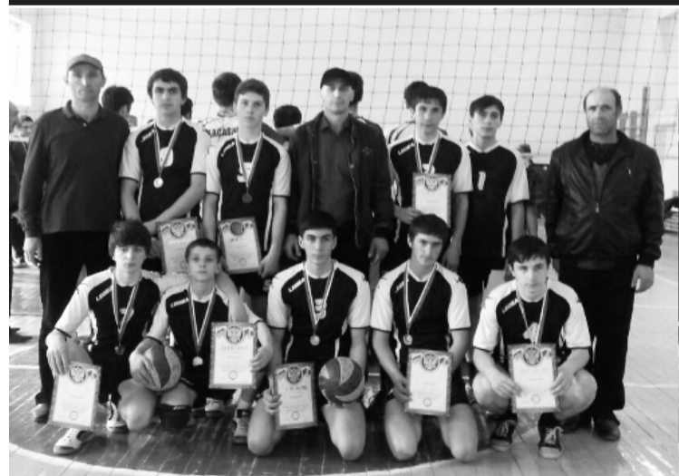
27 марта в Махачкале в спортив-

По всем вопросам и обращениям избирателей депутаты давали разъяснения, а отдельные вопросы для решения доводили до главы муниципального района «Табасаранский район». К сожалению, есть и обращения избирателей, которые депутаты не смогли решить.