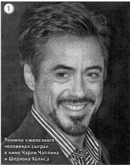
Помимо «железного человека» сыграл в кино Чарли Чаплина и Шерлока Холмса