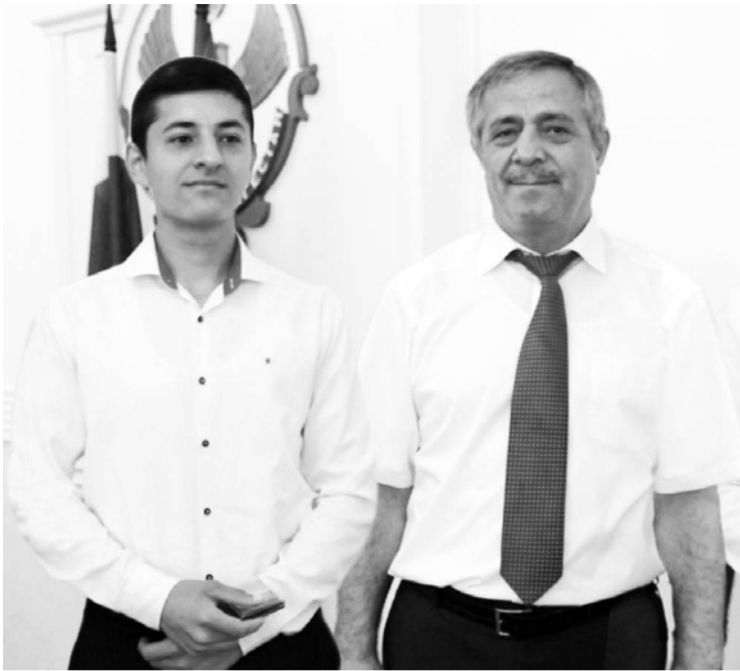
(Эвел 1-пи машнаъ).

мялум шулуки, ЕГЭ – йин натижий райондин мектебарихън – йисаз ужу шула.