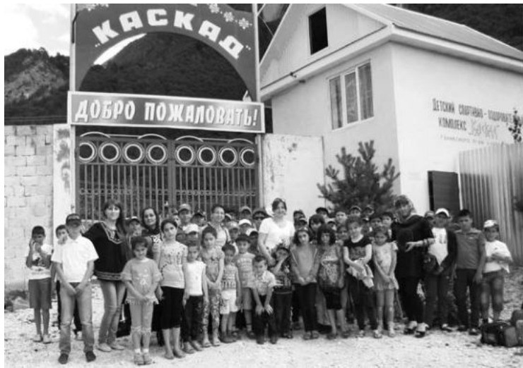
(Эвел 7-пи машнаъ.)

Лагерий ипуб - ухубра ужуйи ккабалгна. Суткаийъ юкьуб ч1евеъ хураг тувру. Бицидарихъди рягъятвал гъадабгъувал ккудубк1айиз ихъ райондиан вожатйирра гъузру. Бицидарихъди жюрбежур серенжемар, тамашйир, конкурсар гъахуру. Тамашйир гъахуз майднар а. Лагерий рягъятвал гъадабгъуз 21 йигъ улупна. Гъадму вахт мянфяагтлуди адап1уз шулу. Мит1лан гъайри, учу гъар сменайиъ кьуб ражари думу лагериз бицидариин улукъузра гъягъури шулча.