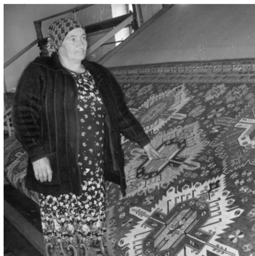
мин ап1уз кюмек шулу».

Гъаму шиклий учвуз рякъюрайи Аьшаханум Къасумова чан уьмур халачачивализ бахш гъап1у кас ву. Биц1иди имидит1ан дадайихъди халачийин гугар кахъуз аьгъю гъап1у мугъу гъамусра халачайин гюрчегъ эсерар яратмиш ап1уру. Къужникарин халачийин цехдиз гъушиган, ягъч1вур йисахъна халачачивалин тажруба айи думу устадари ич сюгъбатнаь гъамаци гъапнийи: узхъан халачайин эсерар яратмиш ап1бахъан ярхла хъуб шулдарзухъан. Думу ляхни, яни халачийир урхували, узду аьхю шадвал хурзуз «ва йиз хизандин дуланажагъ тья-