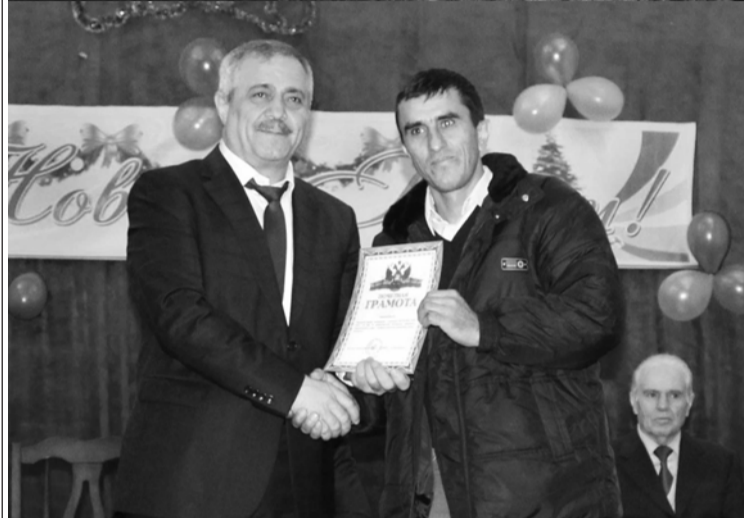
(Эвел I-пи машнаь).

гъа пIнийи. Улубкъурайи цIийи йис сагъвал, шадвал, хъуркъувалар хъайиб, гъарсаб хизандиз берекет ва мясляьт ади гъюроб ибшири.