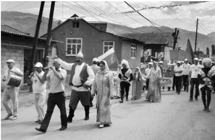
В минувшие выходные в селении Ахты в 15 раз состоялось празднование героического эпоса лезгинского народа «Шарвили».

Среди многочисленных гостей фестиваля были и представители Табасаранского района.