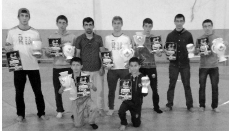
кг, 2 - пи йишв (Хюрикк гъул);

Соревнованийриь гъалиб гъахъидар кубокарехъди, грамотийрихъди ва къиматлу призарихъди лишанлу гъапну.