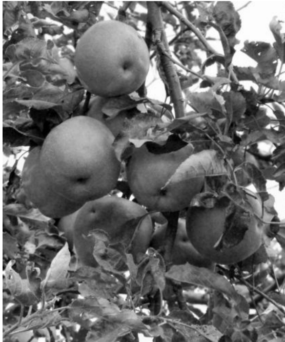
вуза, дурарин кьимат кьуб – шубуб ражари ужузди хьибди.

Ярхлаз гьагьуб лазим шулдар. Мисалназ, ихь райондиь 60 – рилан зина мектебар, 35 – дилан зина биц1идарин багъар, больница, хайлин кьадар кафеяр а. Душварийь сок гьязур ва жара хурагарик ишлетмиш аплуз гьеерццу йимишар лазим шулу. Ихь алверин точкйириь масу туврайи гьеерццу йимишарин кьиматар гизаф багъади ву. Мисалназ, гьеерццу к1ару хуттарин саб кило кьюдварж манатдилан зина ву. Хьа, эгер, ихь шараитарийь дерццу, дурар масу туври гьахьш, умудлу