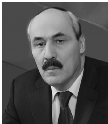
4. Отчет о деятельности отдела МВД России по Табасаранскому району за

3. Отчет о деятельности контрольно-счетного органа муниципального района «Табасаранский район» Республики Дагестан за 2015 год.