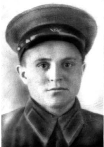
вахт ккудубк1айиз, Ватандин

Ахью дяви ккебгъну. Мевлютовдихъди гъуллугъ ап1ури гъахъирин гафариинди, савадлу баярин гъисабнаьди Тагъитдин офицерар гъазур ап1уру тяди курсариз гъаьну, хъасин дурар жюрбежюр частариз гъаьну.