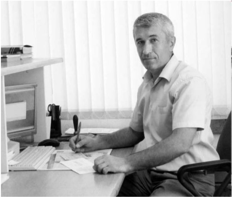
(Эвел 3-пи машнаъ).

читинваларикан саб гьамусеяатна идарйириъ лихурайидарин маважибар карточкайизди хътаувал вуйич. Фици гьапиш, вазлин маважиб тувру вахтна учу душваз гьагъюйча ва агъалйириъ подписка аплуз гьитри шуйча. Гьамус дици шулдар. Ич подписчикар аьхирхъси идарйириъ лихурайидар ву, аьхир.