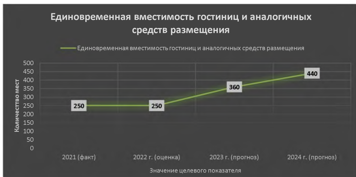
Рис. 3. Единовременная вместимость гостиниц и аналогичных средств размещения по муниципальному району «Табасаранский район» на 2022-2024 гг.