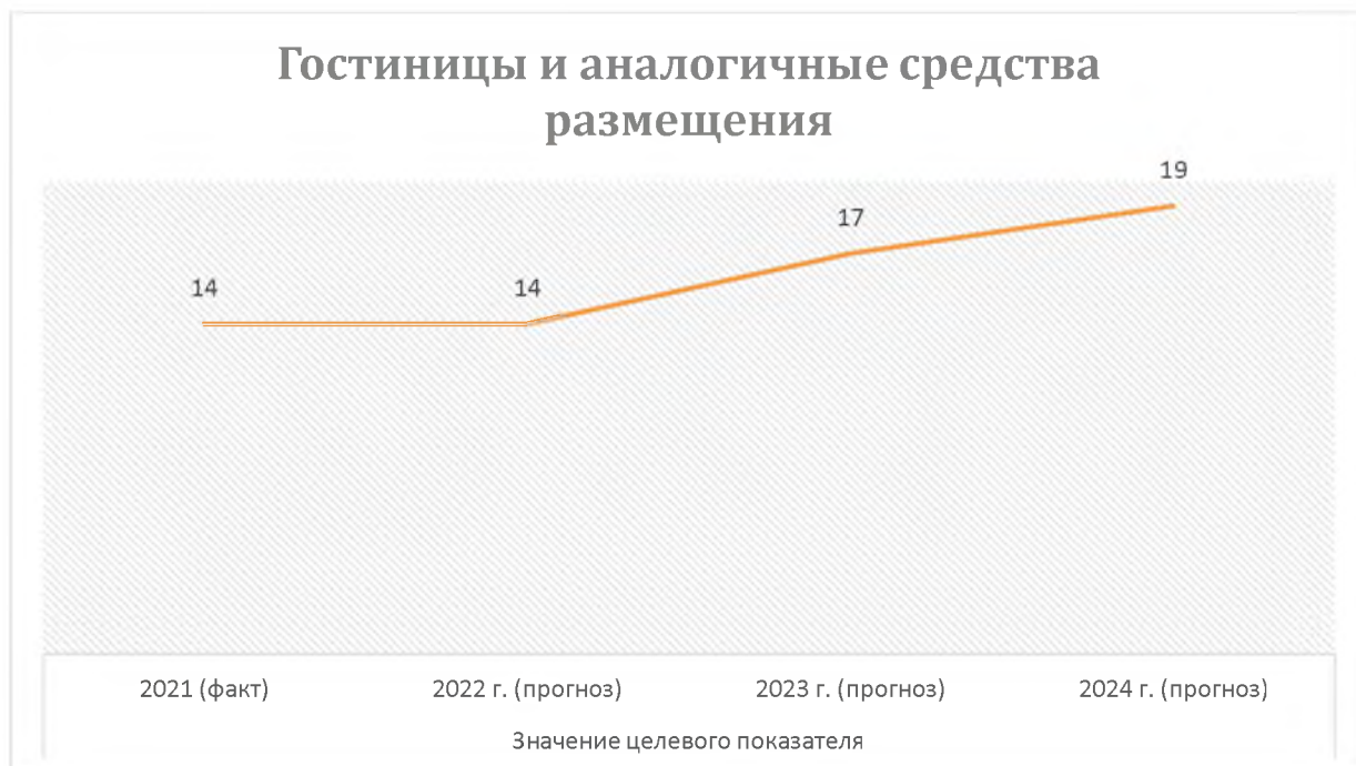
Рис. 2. Количество гостиниц и аналогичных средств размещения по муниципальному району «Табасаранский район» на 2022-2024 гг.