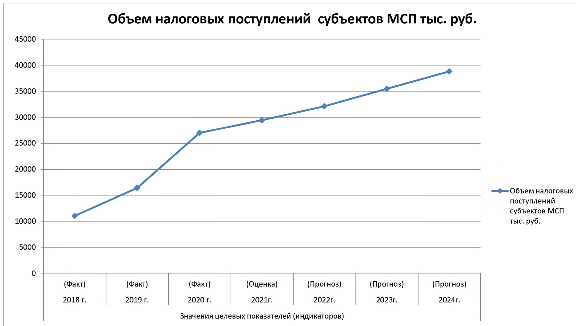
Рис. 3. Объем налоговых поступлений субъектов малого и среднего предпринимательства в МР «Табасаранский район»