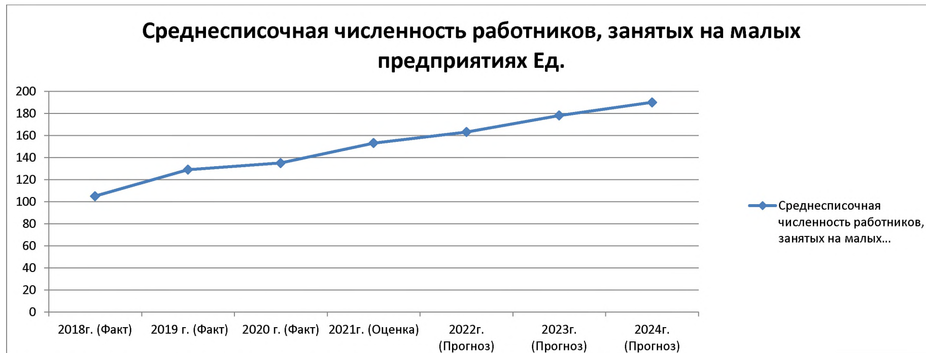
Рис. 2. Среднесписочная численность работников, занятых на малых предприятиях за период 2018-2024 гг.