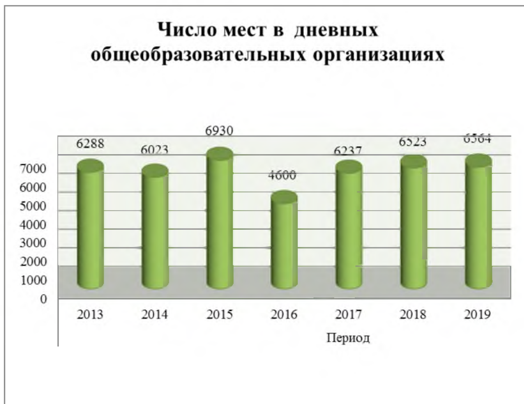
Рис. 11. Число мест в общеобразовательных организациях.

Всего в общеобразовательных организациях района работают 2675 педагогов и сотрудников.