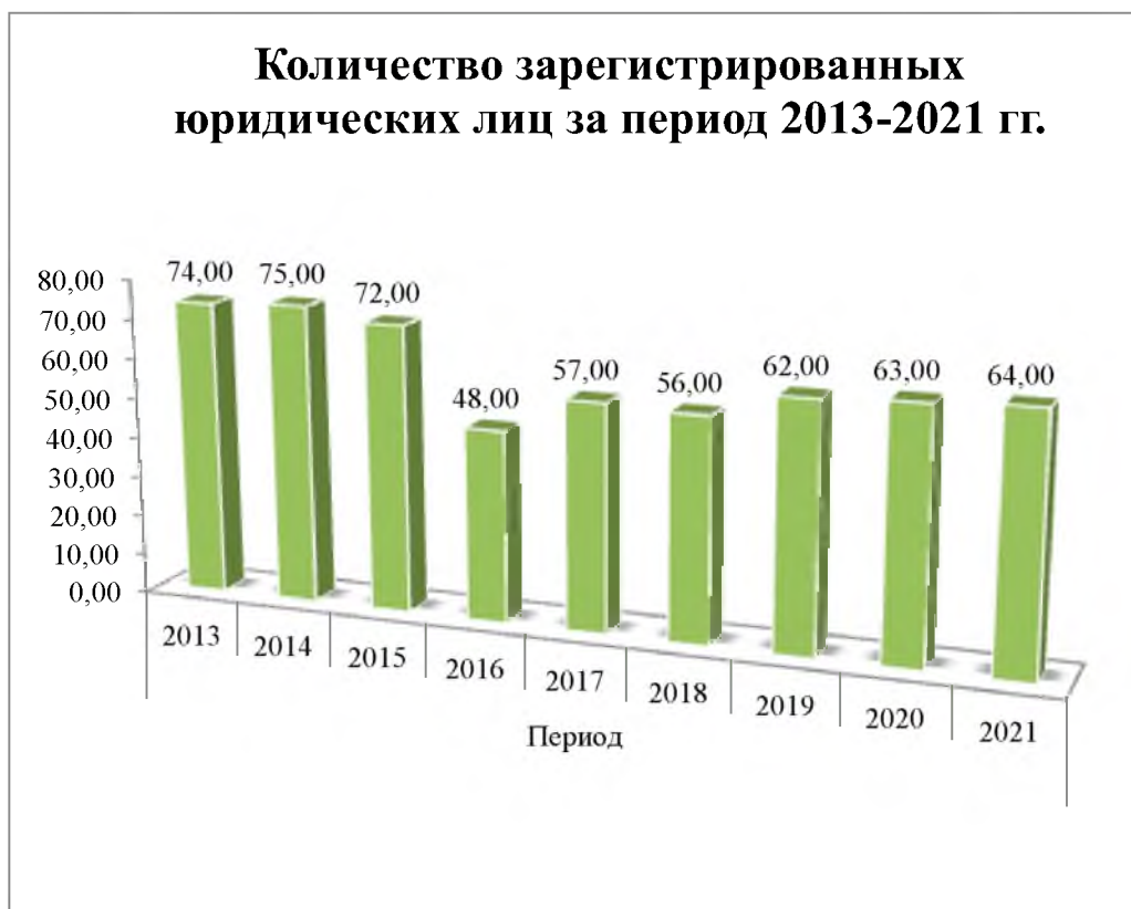
Рис. 10. Количество зарегистрированных юридических лиц за период 2013-2021 гг.

За анализируемый период наблюдается сокращение субъектов малого и среднего предпринимательства в 1,7 раза.