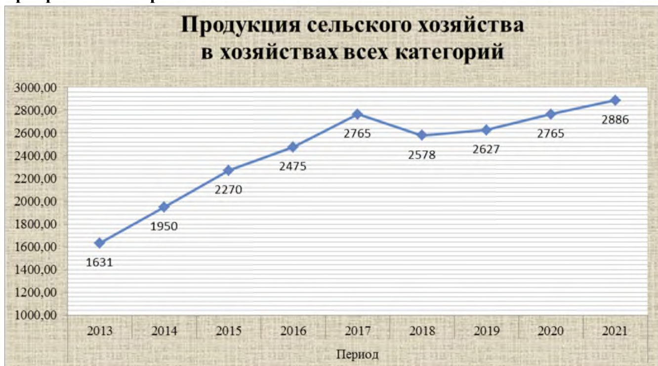
Рис. 8. Продукция сельского хозяйства в хозяйствах всех категорий.

Сельское хозяйство во все времена играло важную роль в экономике и жизни людей и в производственной сфере нашего района является одной из приоритетных отраслей.