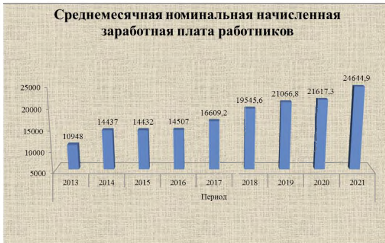
Рис. 7. Среднемесячная номинальная начисленная заработная плата работников за 2013-2021 гг.

Среднемесячная номинальная начисленная заработная плата работников за анализируемый период увеличилось в 2,3 раза. Отообразим графически: