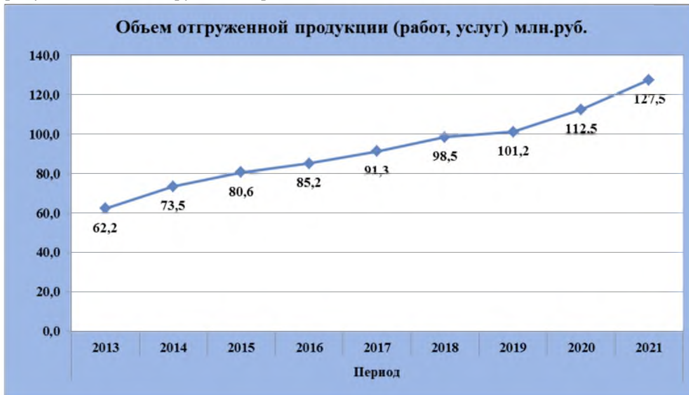
Рис. 3. Объем отгруженной продукции за период 2013-2021 гг.

За период 2013-2021 гг. наблюдается рост объема отгруженной продукции в 2 раза. Отообразим графически рост объема отгруженной продукции за анализируемый период.