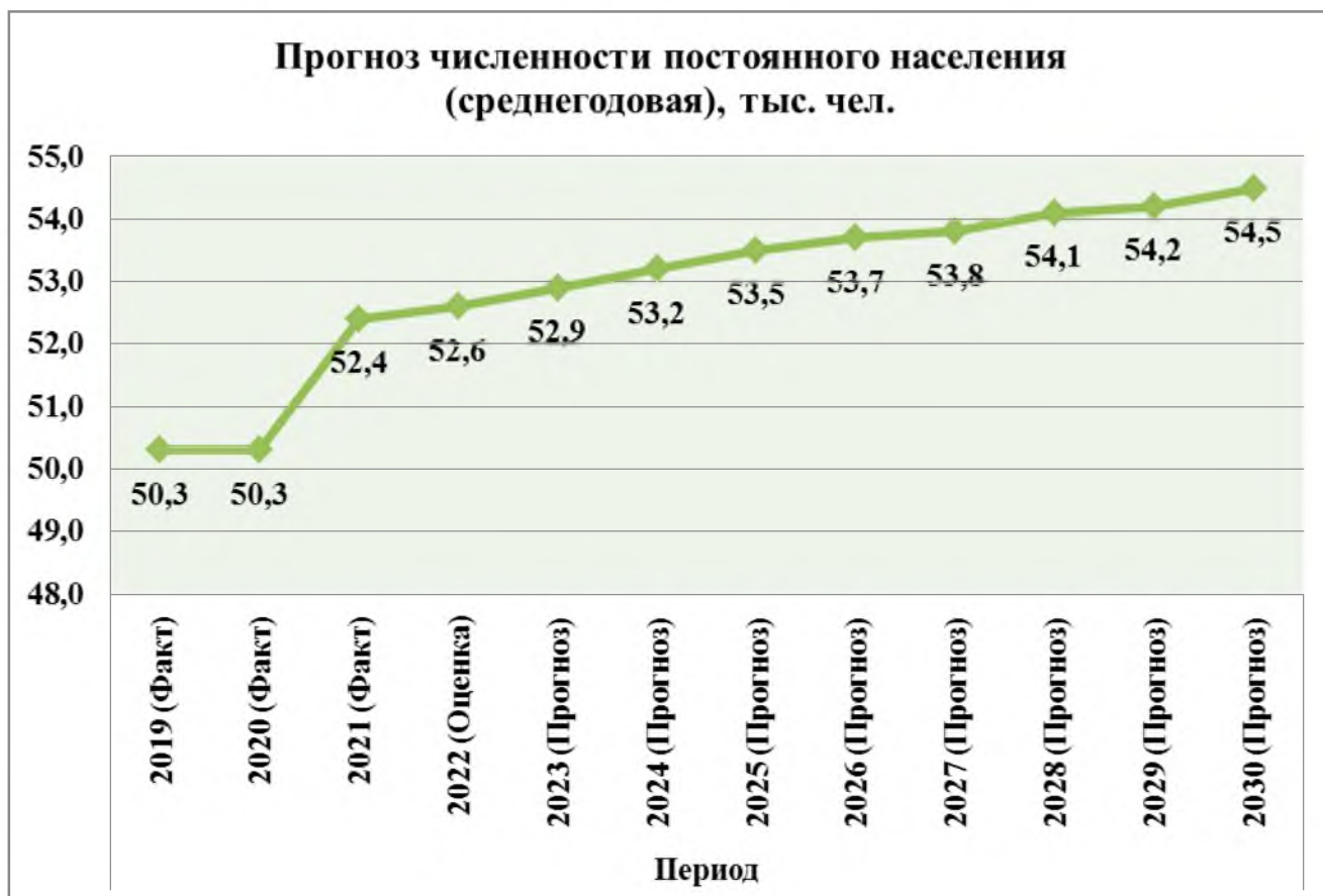
Рис. 12. Прогноз численности постоянного населения.