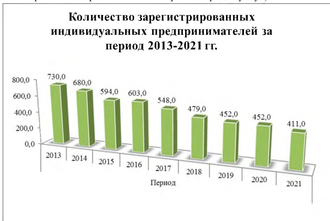
Рис. 9. Количество зарегистрированных индивидуальных предпринимателей за период 2013-2021 гг.

В районе осуществляют деятельность 539 субъекта малого и среднего предпринимательства, из них 62 малых предприятий и 477 действующих индивидуальных предпринимателей. В целях создания благоприятных условий для развития предпринимательства на территории нашего района ежегодно реализуется механизм участия субъектов малого и среднего предпринимательства в выполнении муниципальных закупок (например, для выполнения ремонтных работ и оказания разного рода услуг).