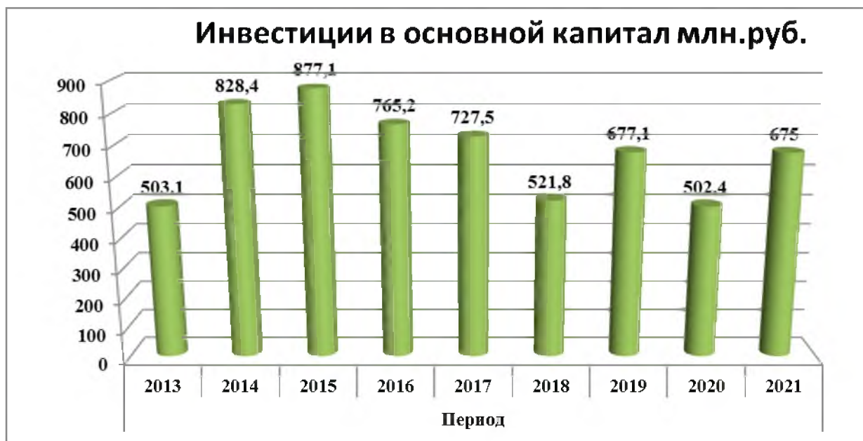
Рис. 4. Объем инвестиций в основной капитал за счет всех источников финансирования за период 2013-2021 г.

В целом благоприятное значение мультипликатора инвестиций долгое время не преобразуется в соответствующую динамику развития экономики района. Свою роль играют значительная доля теневой экономики района и низкая общая эффективность инвестиций, традиционно высокая доля инвестиций в пассивные элементы основных средств: в здания и сооружения.