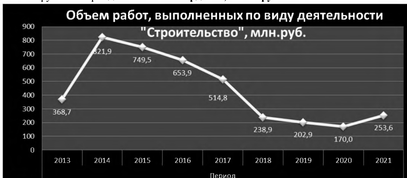
Рис. 5. Объем работ, выполненных по виду деятельности "Строительство" за анализируемый период.

Объем работ, выполненных по виду деятельности "Строительство" за анализируемый период составило 3 млрд. 746,3 млн. руб.