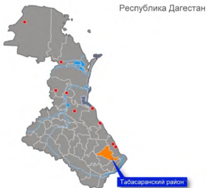
Рис 1.1.1. Расположение муниципального района «Табасаранский район» на карте Республики Дагестан.

Районным центром является село Хучни. Район граничит с МО «Дербентский район», МО «Сулейман-Стальский район», МО «Хивский район», МО «Агульский район» и МО «Кайтагский район». Расстояние от районного центра до г. Махачкалы составляет 177 км. Площадь муниципального образования составляет 803,1 кв. км. (1,6% территории республики). На территории района расположено 74 населенных пункта, объединенных в 22 муниципальных образования. Наиболее крупные населенные пункты – сс. Хучни, Сиртыч, Дюбек, Ерси, Дарваг.