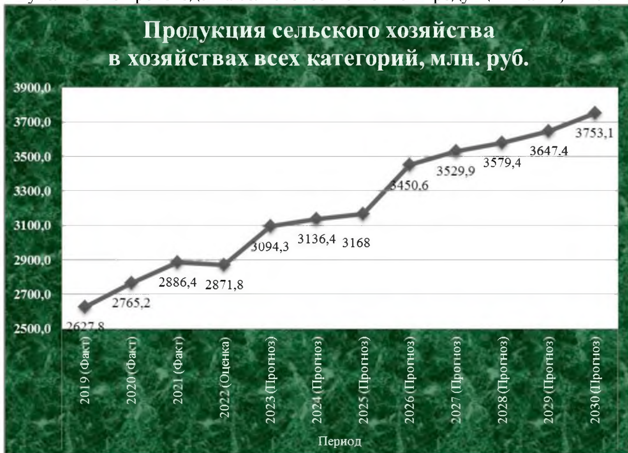
Рис. 13. Прогнозируемый объем продукции сельского хозяйства в хозяйствах всех категорий до 2030 года.

На 01.11.2022 г. на территории муниципального района «Табасаранский район» реализуются 10 инвестиционных проектов на общую сумму на 284, 7 млн. руб. Вложено средств на 01.11.2022 г. на сумму 274,1 млн. руб. (Приложение № 8)