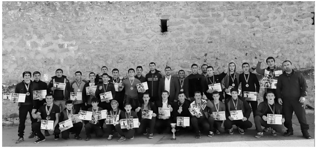
4 ноября на территории, прилегающей к Крепости семи братьев и одной сестры, прошли районные соревнования среди школьников.