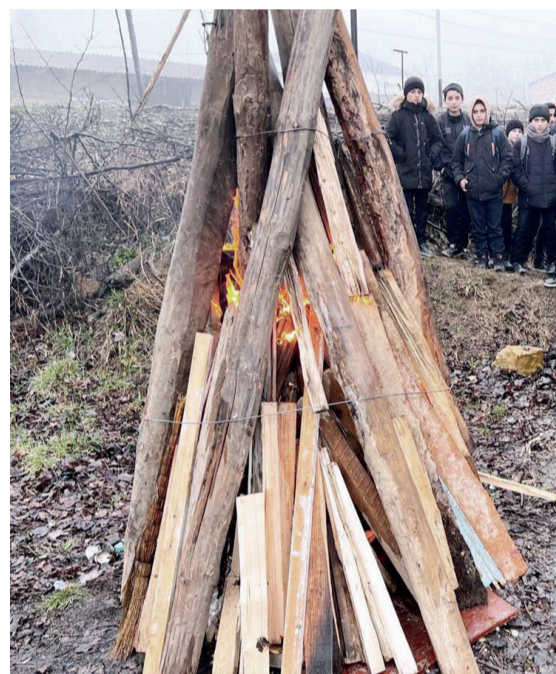
20 марта в с. Ерси Табасаранского района состоялось яркое и насыщенное концертную программу представили учащиеся Ерсинской