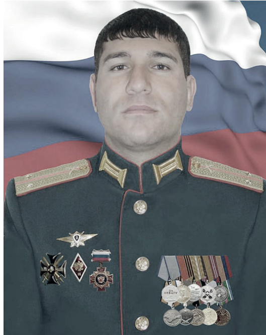
месэлийр лайикълувалиинди тамам аплура лигну, му саб-швнуб ражари лишанлу

СВО кIули гьабхурайи вахтна, чан улихъ диву женгназ