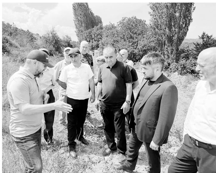
хъпан бадали, 1960-пи йисан Бильгандаш штун къанав

Дупну ккундуки, ихъ райондин этег терефнаь яшамиш шулайи гъуларин агъалйирин аьхюну пай жилихъ лихурайидар, яни жил тартиб аплури, гъясилвалихъ хъайидар ву. Хъа жил тартиб аплурайидариз, ухъуз агъюганси, шараитарра яратмиш дап1ну ккунду. Думу терефнаь жилихъ лихурайидарин багъариз, бистнариз, хут1лариз шид тувуз мумкинвал