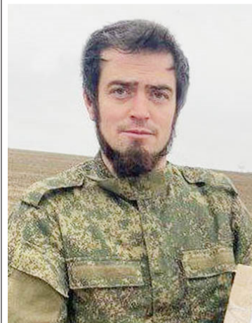
Указом президента РФ за мужество и отвагу, прояв-