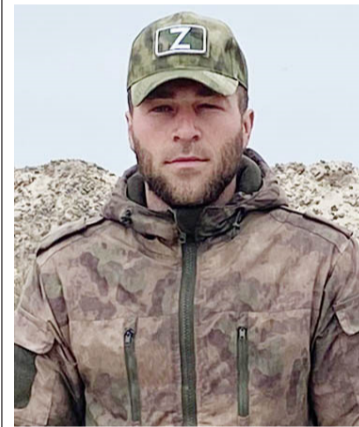
Указом президента РФ за мужество и отвагу, про-