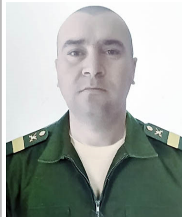
Указом Президента Российской Федерации, за мужество и отвагу, проявленные при исполнении воинского