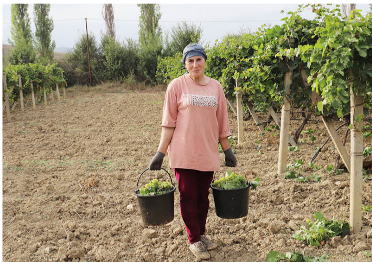
жилилан гъазанжар гъадагъуз хъюгъна. Ихъ алве-

Октябрин 9 – ди гъулан мяишатдин ва тартиб аялру промышленностдин работникдин йигъ къайд аялди. Райондин гъулан мяишатдин цирклихъ лихурайи вари ксар чпин пишекарвалин машкврахъди