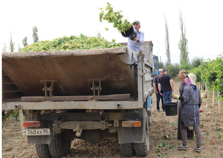
86 гектариан-781 тонн (91 центнер) жвугърийр; 35

жарадар ужузи гъилихну. Гъарсаб цирклихъ лихурайи-