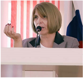
(Эвел 1-пи машнаъ.)

лимар, шаирар ва писателар иштирак гъахъну.