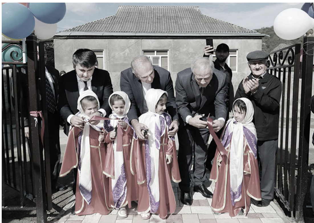
си, аьхиримжи йисари ихъ райондин гьуларий мицдар 15 сквер тикмиш гьап1ну

Хючна гьулан Цалак мягьял тешкил дап1ну секи хьуц1ур йис тамам шула. Думу тешкил ап1руган, душваъ «Хучнинский» совхоздин идара айи. Думу совхоздиъ лихурайи рабочйириз хулар тикмиш ап1балан Цалак мягьял ккебгънийи. Гъи Цалак мягьялиъ шубудварждилан зина хизан яшамиш шула. Саб вахтна душваъ ккергъбан классарин мектеб гьаракатнаъ айи. Гьамус думу имдарди хайлин йисар ву, думу мягьялин баяр-шубар Хючнаарин 1-пи нумрайин лицейиз гьагьюра. Лицейи дурар, «Газелиъди» мектебдиз гьахура ва къяляхъ хура. Гьацира Цалак мягьялиъ «Теремок» бицидарин багъ ва ФАП, мини-футболдин майдан гьаракатнаъ а. Гьамус, яни 4-пи октябриъ душваъ бицидариз вуйи цийи сквер ачмиш гьап1ну. Ухьуз мялум вуйиган-