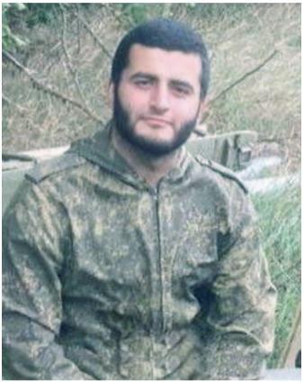
Приказом Министра обо-