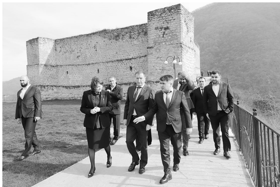
ляхнарихъди таниш гъахъну.

Проектдиз асас, музейин асас дараматдиз гъваъ ва пол дигиш ап1иди ва жара ляхнар гъахиди. Думу музейин Къалухъ Мирзайин ччвурнахъ хъайи спорткомплексдиъ ерлешмиш дубхънайи филиалиъ мани ап1ру кьурулуш