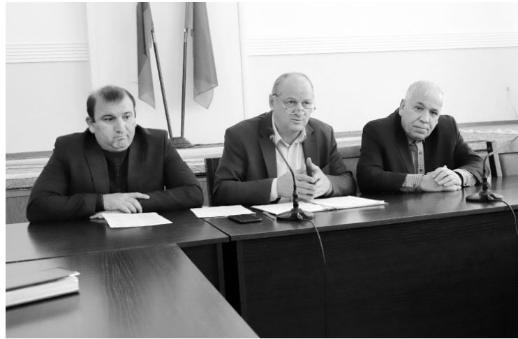
ления, выплаты и перерасчета ежемесячной доплаты к пенсии лицам, замещающим муниципальные должности

По первому вопросу повестки: об утверждении положения о порядке установ-