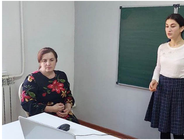
(Эвел 7-пи машнаь.)