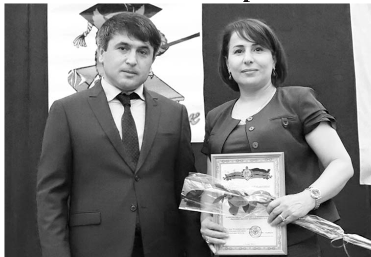
(Эвел 7-пи машнаь).

ру. Цици, яни 2021-пи йисан деету выпускной классдиь 19 выпускник айич. Гьадририккан Гьаваханум Исмялиовнайи гьабхурайи предметдиан (урус ч1алнаан) 5 урхурайири 90-рилан зина баллар гьазанмиш гьап1ну. Гьадму классдиь урхурайидарин кьялан балл 81,3 гьисаб шулу. Хьа гьадму классдиь айидарин 9-пи классдиь урхурайиганра (думуган думу классдиь 24 урхурайи айи) 17 урхурайири урус ч1алнаан ОГЭ заан баллар гьазанмиш ап1биинди тувнийи.