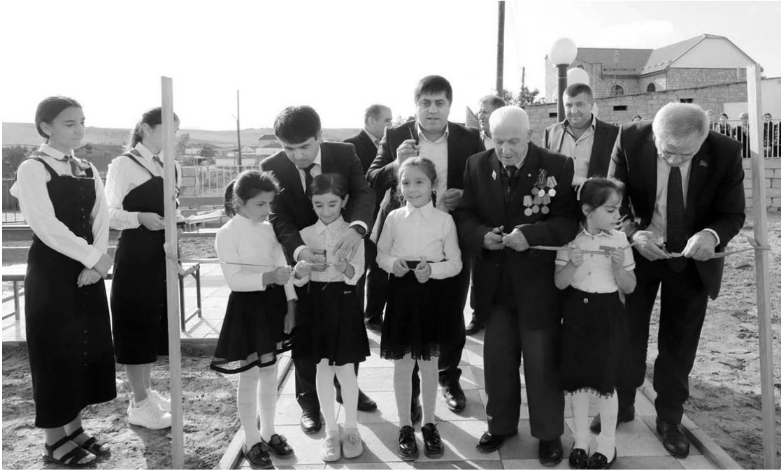
(Эвел 1-пи машина).

Несретдин Гъажибрагимов к1ули ади, саб десте гьулан агъалйир майдан тикмиш ап1бан гъакънаан учухъна илт1ик1нийи. Проектра дюзмиш гъап1нийи, РД – йин Ми-