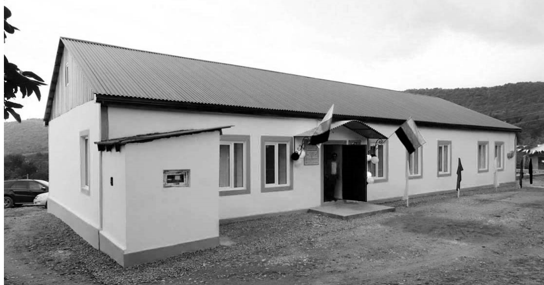
Н.РЯГЪИМОВДИ гъиву шиклар.

Тинит1 гъулаъ культу- райин Хал 1967-пи йисан тикмиш гъапну дарамат- диъ ерлешмиш дубхънайи. Гъелбетда, думу дарамат ахиримжи йисари лап аъ- жуз гъалназ дуфнайи. Рай- ондин администрацияйин кюмекниинди думу дарамат капитально рас апбан проект гъазур гъапнийи ва РД-йин Минэкономраз- витияйи гъабхурайи «Ерли жягътлувалар» конкурсдиъ хътапнийи, душваъ думу къабул гъапнийи.